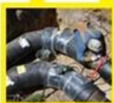
Afsluiter 1 & 2 komen uit op het groene warmtenet

Alle aanpassingen aan het warmtenet, aan de binnenkomende leidingen en aan de warmteset zelf, dienen gedaan te worden door Warmtebedrijf Veenendaal