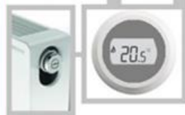
Afsluiter 3 & 4 komen uit op de binneninstallatie

Raadpleeg uw installateur of verhuurder bij aanpassingen aan uw binneninstallatie w.o. de leidingen, radiatoren, thermostaat, en vloerverwarming.