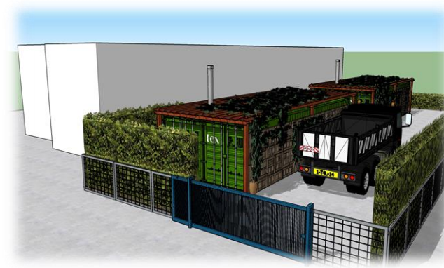
Mogelijke opstelling Buurtwarmte-unit